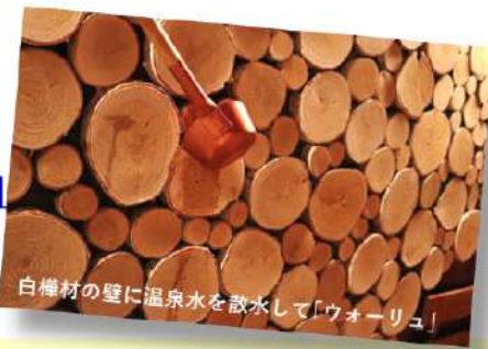
白樺材の壁に温泉水を散水して「ウォーリュ」