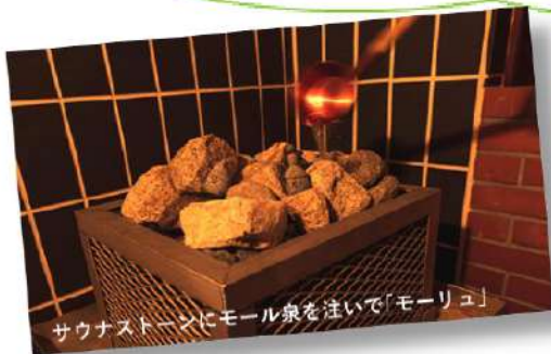
サウナストーンにモール泉を注いで「モーリュ」

2019年6月、サウナをリニューアル！ 十勝初！本場フィンランド式「ロウリュ」や 壁に施した十勝「白樺」の香りがより深いリラックスへと導きます！ 40カ国以上のサウナを体験したプロサウナーお墨付き